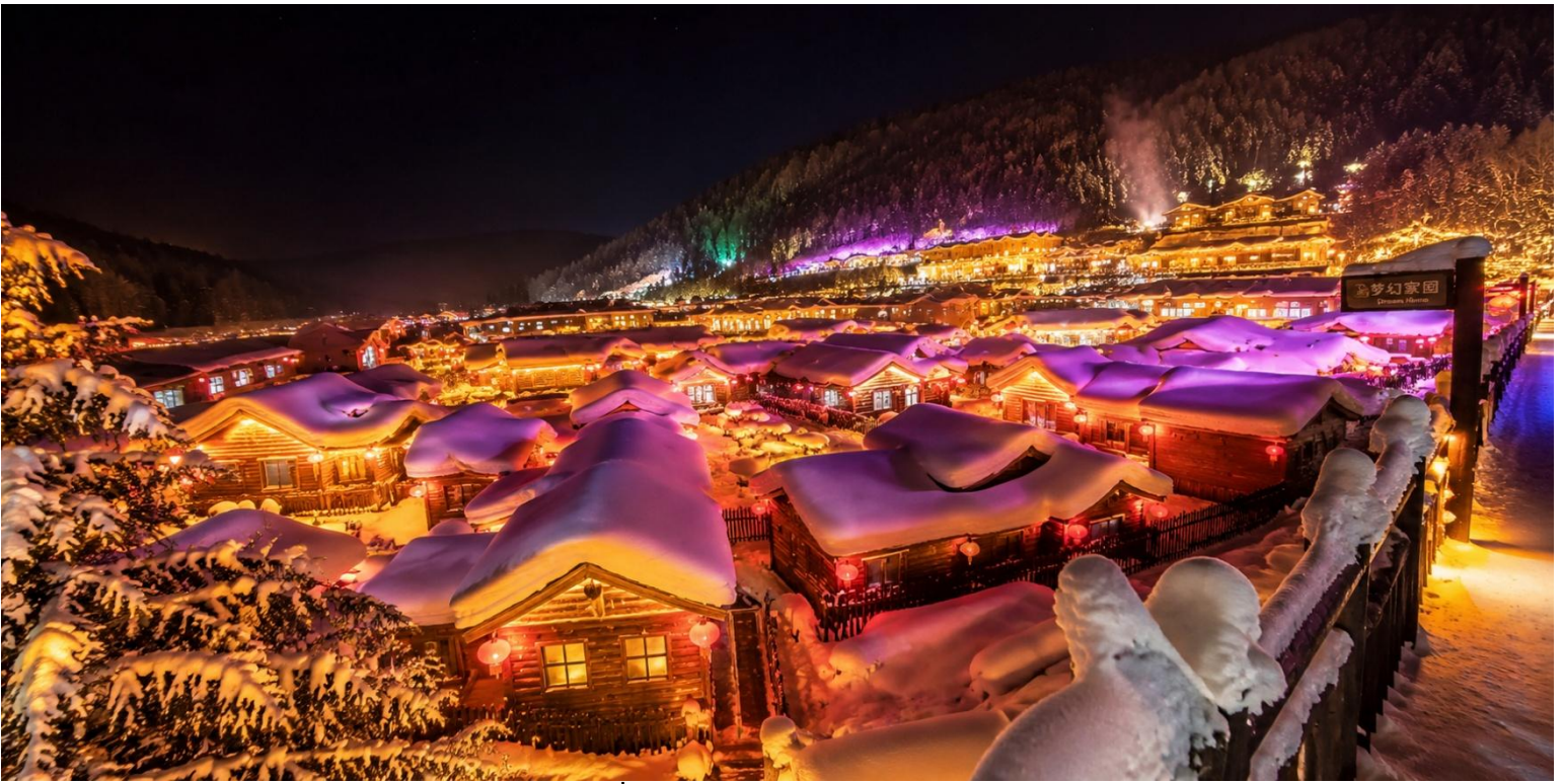
สมควรแก่เวลานำท่านเดินทางเข้าสู่ที่พัก โฮมสเตย์สไตล์จีน หมู่บ้านหยงอัน หรือเทียบเท่า