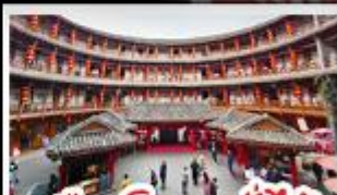
เมืองโบราณลั่วไต้