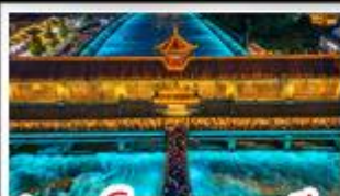
สะพานโบราณหนานชิว

อุทยานต้ากู่ปิงชว่น - อุทยานสี่ดรุณี - รมี่แพนด้าเซลฟี น้ำพุไม้ไผ่ตึกSKP - อุทยานปีศาจโทว - สะพานโบราณหนานชิว สตรีทอาร์ต Eastern Suburb Memory - เมืองโบราณลั่วไต้ เมบูพิศษ มื้อไฟหมาล่า