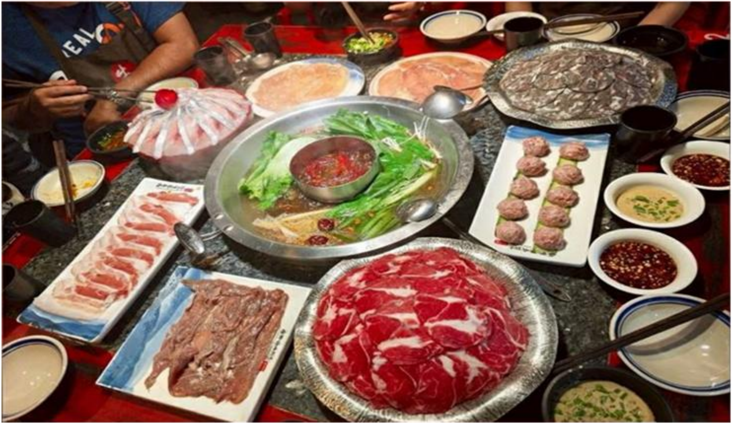
คำ รับประทานอาหารค่ำ ณ ภัตตาคาร (เมื่อที่ 12) *เมนูพิเศษสุกี้หมอลำเสวน

ดั้งเดิม มีทั้งแบรนด์แฟชั่นระดับโลกอย่าง Gucci, Chanel, Balenciaga รวมถึงร้านค้าไลฟ์สไตล์และแฟชั่นท้องถิ่น อาหารท้องถิ่นและคาเฟ่นานาชาติสวยๆ ที่เหมาะสำหรับการนั่งพักผ่อน