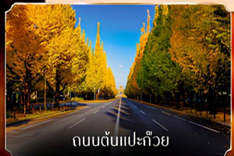
ถนนต้นแปะก๊วย