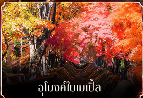
อุโมงค์ใบเมเปิ้ล