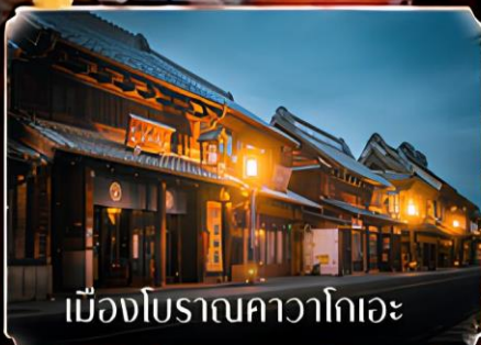
เมืองโบราณคาวาโกเอะ