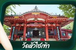
วัดหัวโซเก้ซ่า

พุ่งตัวไปทักทายฟูจิซังแบบเอ็กซ์คลูซีฟ ขึ้นจุดชมวิวจีน 5 โพลสต่าถ่ายรูปคู่สุดปัง ชมเสน่ห์เมืองเก่าคามาคุระ สักการะพระโศกใหญ่โอบุตสึคามาคุระ ตามรอยซีรีส์ดัง นั่งรถไฟวินเทจ... ชมวิวชวนฝัน สู่เกาะโอโนชิมะ ขอพรด้านความรัก วัดหัวโซเก้ซ่า ห้ามพลาด! โคมไฟยักษ์ วัดอาซากุสะ ปิดท้ายด้วยช้อปปิ้งจุใจในโตเกียว ทักทาย “แมว 3D” ย่านชินจูกุ