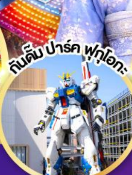
กันดั้ม ปาร์ค ฟุคุโอกะ