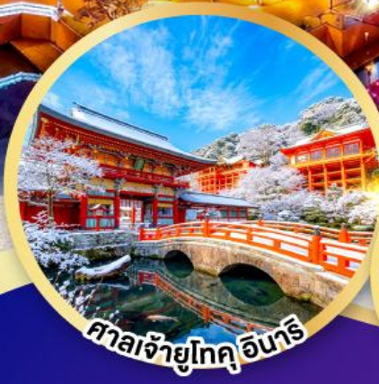
ศาลเจ้าโทคุอินาริ