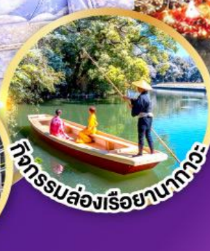
กิจกรรมล่องเรือยามทิว