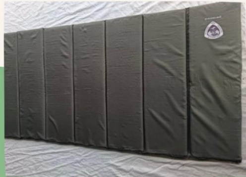
ที่รองนอน