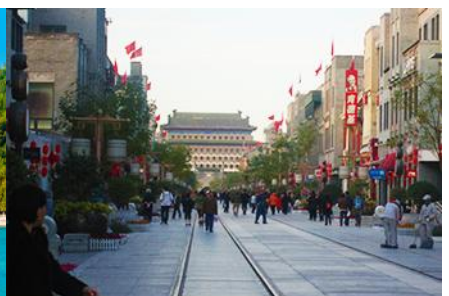
ถนนเจียนเหมิน