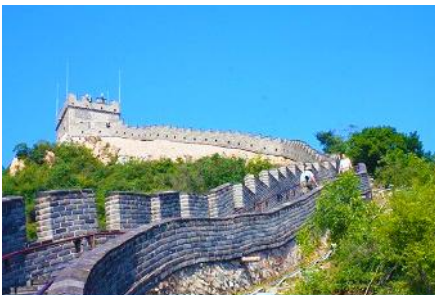
กำแพงเมืองจีนด่านวิยวกวน

พักที่ JINGLIN HTL OR HOLIDAY INN EXPRESS HTL 4* หรือโรงแรมในระดับเดียวกันในกรุงปักกิ่ง