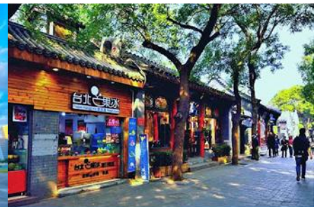
ชอยหนานหลวู่ชี่เยว