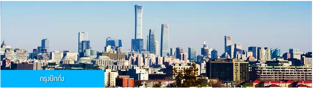
กรุงปักกิ่ง