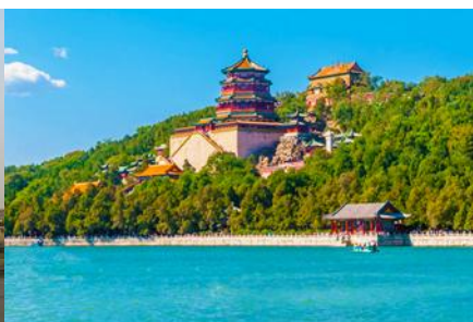
พระราชวังฤดูร้อนหยี่เหอหยวน