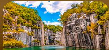
เขาดินป่าเมืองโพซอน

26 - 30 พ.ย. 69 21,900 03 - 07 ธ.ค. 69 21,900 09 - 13 ธ.ค. 69 21,900