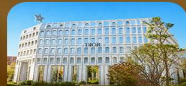
ย่านซองซู