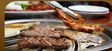
เมนูช่างสตีลเกาหลี