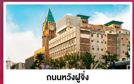
ถนนหวังฝูจิ้ง