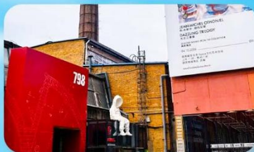
798 Art Zone