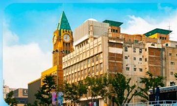
ถนนหวังฝูจิ่ง