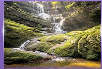
น้ำตกสายทิพย์