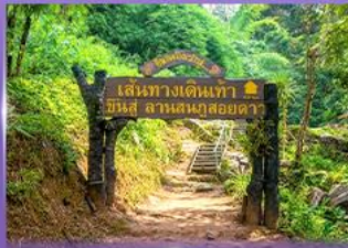
พีช 5 เป็นวัดใจ