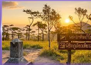
ชมพระอาทิตย์ขึ้น กุสอยดาว