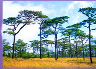
ลานสนกุสอยดาว