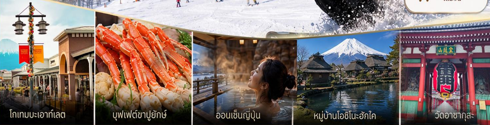
โทเกมมะเอาก์เลียต