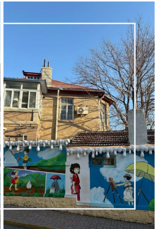
ถนนหลงเจียง (Longjiang Road)

นำท่านสู่ ถนนคนเดิน Silver Fish หรือที่รู้จักในชื่อภาษาจีนว่า “Yutai Road” ตั้งอยู่ในย่านใจกลางเมืองชิงเต่า เป็นหนึ่งในแหล่งท่องเที่ยวและแหล่งช้อปปิ้งยอดนิยมที่สะท้อนสีสันและวิถีชีวิตของคนท้องถิ่นได้อย่างชัดเจน ถนนสายนี้มีชื่อเสียง