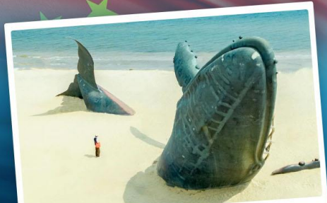
ประติมากรรมวาฬโศกเดี่ยว

เที่ยวเมืองชายทะเลไวปดีดี ซิงเต่า - ต้าเหลียน - ฉะจีงไถ่