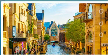
เมืองน้ำวนิสตะวันออก