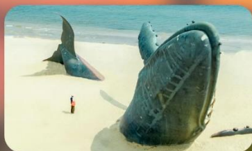
ประติมากรรมวาฬโดคเตี้ยว