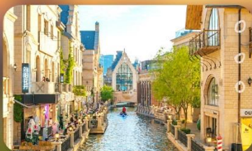
เมืองน้ำเวนิสตะวันออก