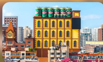
โรงงานเบียร์ซิงเต่า