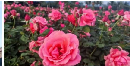
สวนกุหลาบเหมยกุ้ยกุ