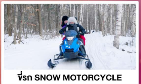
ขี่รถ SNOW MOTORCYCLE