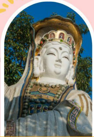
รีพลัสเบย์ รับพลังงานดี เสริมพลังฮวงจุ้ย