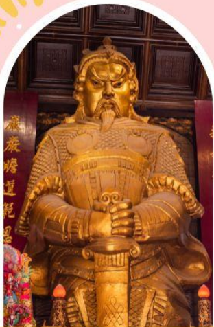
วัดแขก ขอพรโชคลาก การเงิน และธุรกิจ