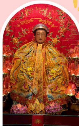
วัดหลังโหมว ความสำเร็จ ความมั่งคั่ง เงินทองไหลมาเทมา