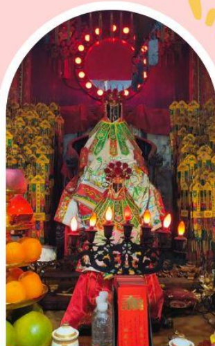
วัดเจ้าแม่กวนอิมฮ่องฮำ ขอพรเรื่องเงิน ทรัพย์สิน และความมั่งคั่ง