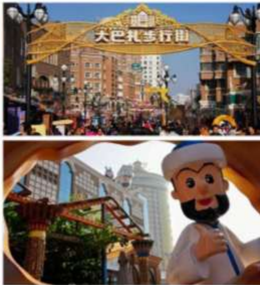
ตลาดนานาชาติซินเจียงแกรนด์บาร์ซาร์