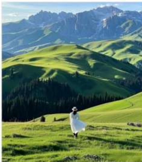
ทุ่งหญ้าคาลาจวิน