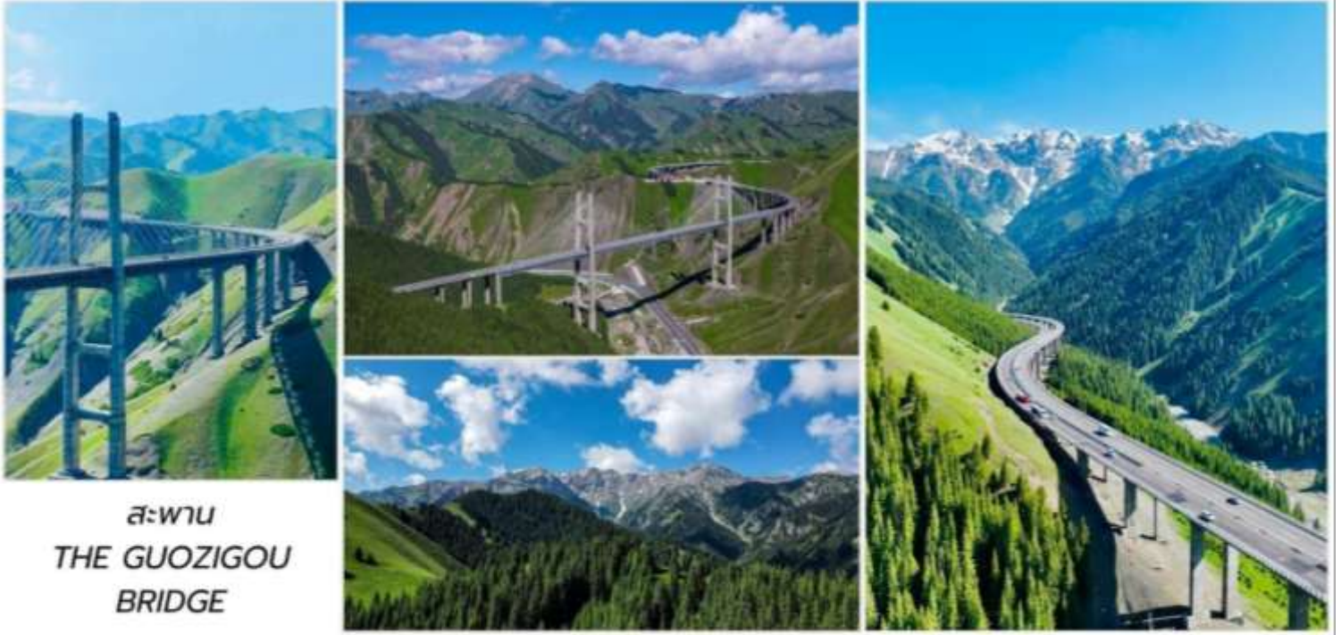
สะพาน THE GUOZIGOU BRIDGE

ใช้เวลาเดินทางประมาณ1.5-2ชั่วโมงนำท่านชม ถนนหกดาวหรือถนนลิวซิง(LiuxingStreet, 六星街) เป็นจุดท่องเที่ยวที่เป็นที่รู้จักเป็นอย่างมากของเมืองอี่หนิงถูกสร้างขึ้นในปี1934และถูกออกแบบและสร้างเป็นรูปหกแฉกภายในพื้นที่เต็มไปด้วยบ้านพร้อมสวนสไตล์จีนเฉียงโดยที่เกือบทั้งหมดมีผนังที่ทำด้วยสีฟ้าและหลังคาสีชมพูผสมผสานไปด้วยดอกไม้บานนานชนิดซึ่งสีที่สดใสและสไตล์อันมีเอกลักษณ์นั้นรังสรรค์ให้ที่ถนนนี้มีลักษณะที่เหมือนสิ่งๆที่ออกมาจากในเทพนิยาย อิสระอาหารเย็นเพื่อสะดวกแก่การท่องเที่ยว ที่พักShunWenHotels:ระดับ4*หรือเทียบเท่า