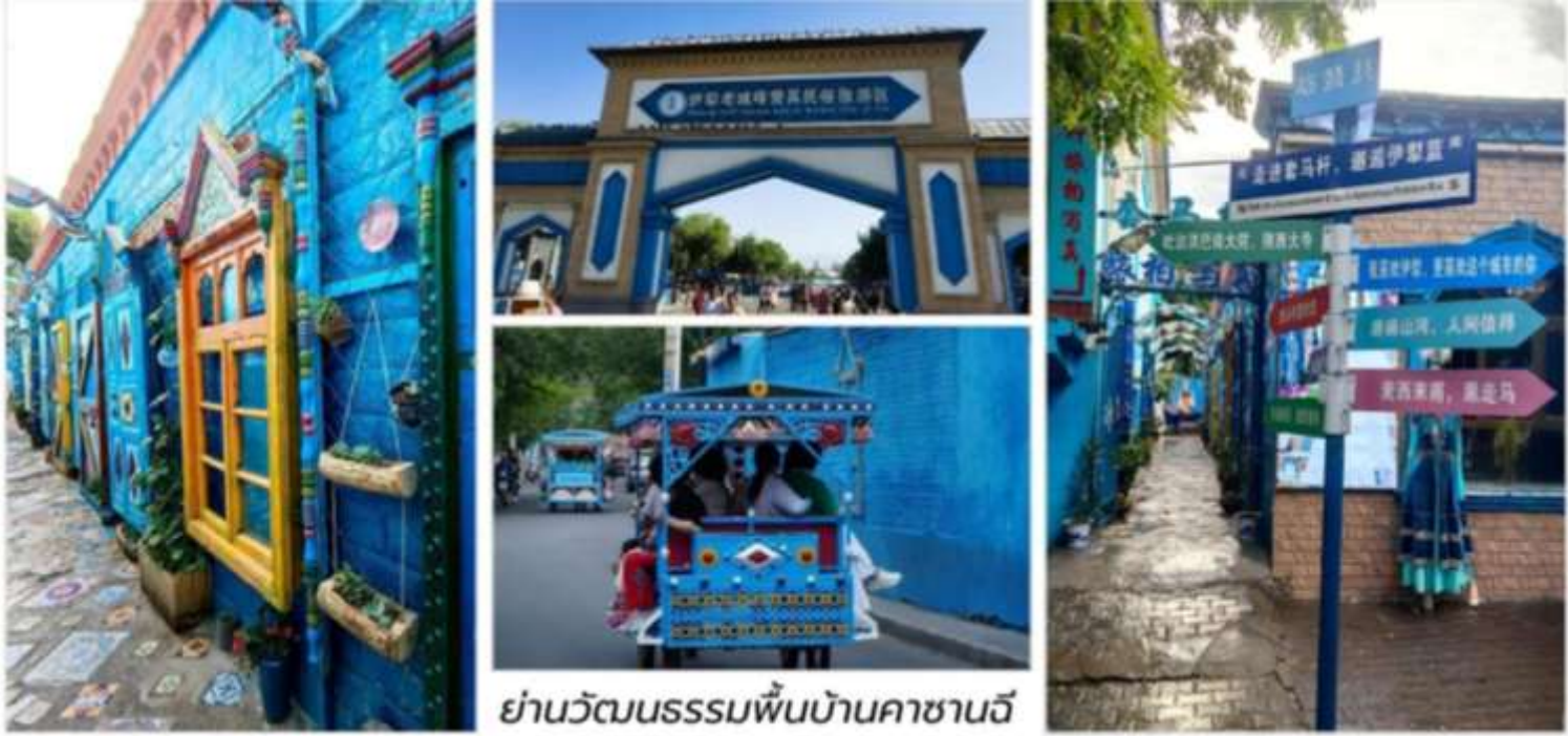
ย่านวัฒนธรรมพื้นบ้านคาซานฉี

ดั้งเดิมของชาวอุยกูร์และชนกลุ่มน้อยในซินเจียงแบบใกล้ชิดที่สุดย่านคาซานฉีเปรีียบเสมือน“พิพิธภัณฑ์มีชีวิต”ที่บอกเล่าเรื่องราวของผู้คนผ่านบ้านดินโบราณสีอบอุ่นตรอกแคบที่คดเคี้ยวและรอยยิ้มของผู้เฒ่าผู้แก่ในชุดพื้นเมืองที่นี่เต็มไปด้วยบ้านเรือนแบบอุยกูร์ดั้งเดิมกว่า300หลังซึ่งสร้างขึ้นมาตั้งแต่ยุคราชวงศ์ชิงและได้รับการอนุรักษ์ไว้เป็นอย่างดีงามอิสระให้ท่านได้เลือกเดินชมงานหัตถกรรมพื้นบ้านเช่นการทอพรม, แกะสลักไม้, ตีทองแดงและการทำขนมแบบอุยกูร์พร้อมชมการแสดงดนตรีและการเต้นพื้นเมืองที่จัดขึ้นเป็นระยะเส่นห์ของคาซานฉียังอยู่ที่วิถีชีวิตที่ดำเนินไปอย่างเรียบง่ายผู้คนยังคงอบบ่มปัง“นาน”ในเตาโบราณพูดภาษาท้องถิ่นและยิ้มต้อนรับนักเดินทางด้วยความจริงใจย่านนี้เป็นที่รวมของวัฒนธรรมอาหารศิลปะและวิถีท้องถิ่นอย่างแท้จริงจนกลายเป็นจุดหมายสำคัญสำหรับนักท่องเที่ยวที่ต้องการเปิดมุมมองใหม่ของซินเจียงไม่ใช่แค่ทะเลทรายหรือภูเขาหิมะ