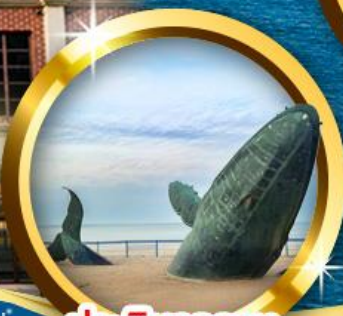
ประติมากรรม วาฬผู้โดดเดี่ยว