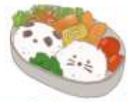
🟡 อาหารสำหรับเด็ก ( 2-11 ปี ) *วัตถุดิบขึ้นอยู่กับทาวรัน