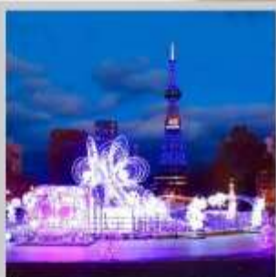
"SAPPORO WHITE ILLUMINATION"