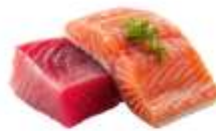
🟡 ไรทานปลาดิบ