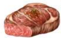
🟡 ไรทานเนื้อหมู