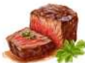
🟡 ไรทานเนื้อวัว

ขอความกรุณาแจ้งวัตถุดิบที่ท่าน แพ้หรือไม่สามารถรับประทานได้