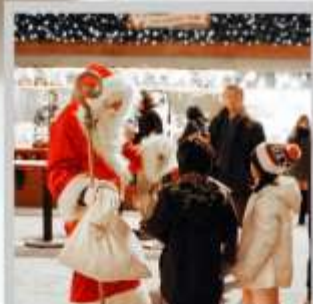
"ODORI GERMAN MARKET"