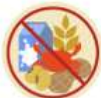
🟡 แฝ้ออาหาร / อื่นๆโปรดระบุ