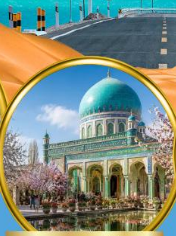
สุสานสมหอมเซียนเฟย