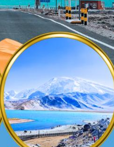
Kala Kule Lake