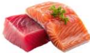
● ไม่ทานปลาดิบ