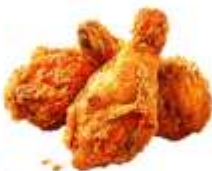
● ไม่ทานสัตว์ปีก (ไก่)