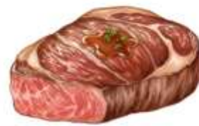
● ไม่ทานเนื้อหมู