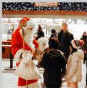
"ODORI GERMAN MARKET"