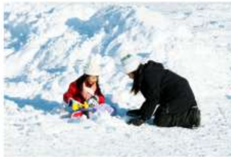
Playing in the snow