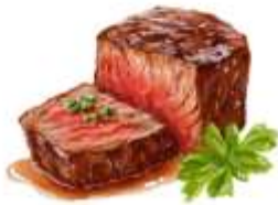
● ไม่ทานเนื้อวัว

ขอความกรุณาแจ้งวัตถุประสงค์ที่ท่าน แพ้หรือไม่สามารถรับประทานได้