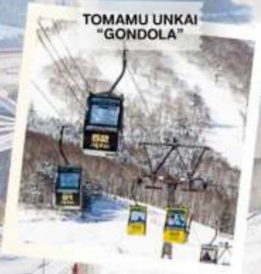
TOMAMU UNKAI "GONDOLA"