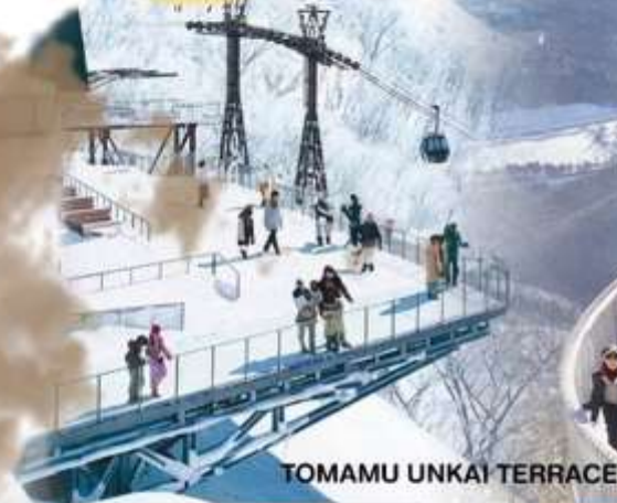
TOMAMU UNKAI TERRACE