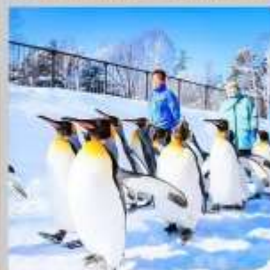
"PENGUIN ASAHIYAMA ZOO"