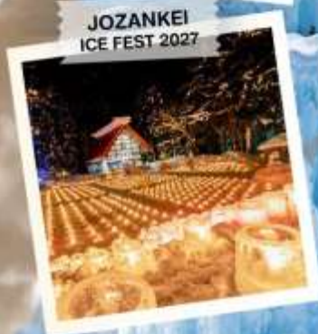
JOZANKEI ICE FEST 2027