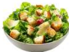
● ผักสดวิธีดี