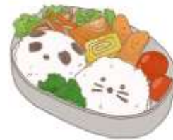
● อาหารสำหรับเด็ก ( 2-11 ปี ) *วัตถุดิบขึ้นอยู่กับทาว์ราน