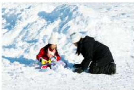
Playing in the snow