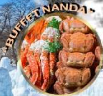
LAKE SHIKOTSU ICE FESTIVAL 2027