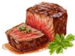
● ไม่ทานเนื้อวัว

ขอความกรุณาแจ้งวัตถุประสงค์ที่ท่าน แพ้หรือไม่สามารถรับประทานได้