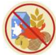
● ห้ามอาหาร / อื่นๆโปรดระบุ