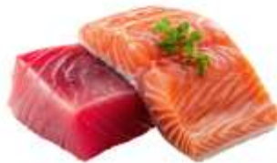
● ไม่ทานปลาดิบ