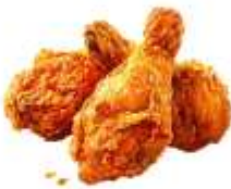
● ไม่ทานสัตว์ปีก (ไก่)