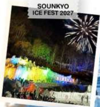
SOUNKYO ICE FEST 2027