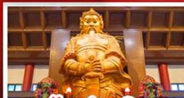
วัดเชกงหมิว