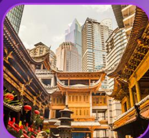
"วัดหลิวฮั่น"