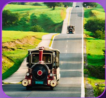
"อุทยานเขานางฟ้า"

บินตรงจงชิง • อุ่หลง • ระเบียบแก้ว • อุทยานแห่งชาติหลุมฟ้า • ลิฟต์แก้ว อุทยานเขานางฟ้า • ไคว่ซิงโหล่ซัน 1 กลายเป็นชั้นที่ 22 • อาคารตะเกียบ ถนนคนเดินเจียฟางเปย์ • หงหยาดัง • นังรถไฟทะเลตุ๊ก • วัดหลิวฮั่น