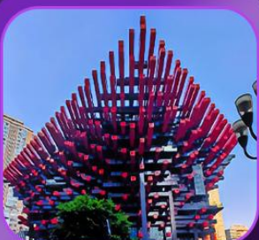
"อาคารตะเกียบ"