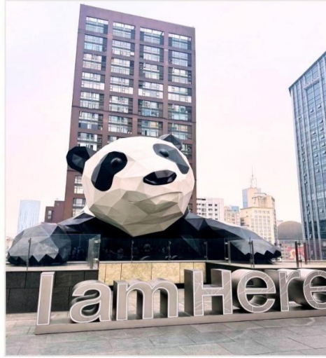
หมี่แพนด้ายักษ์ กำลังป็นตึก IFS