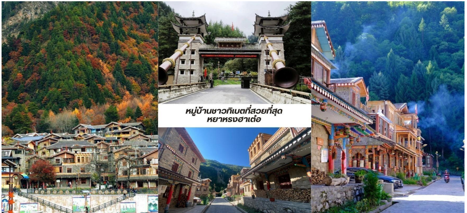
หมู่บ้านชาวกิเบตที่สวยงามที่สุด หย่าหงฮ่าเต๋อ

บ่าย นำท่านชม หมู่บ้านชาวกิเบตที่สวยงามที่สุด หย่าหงฮ่าเต๋อ (Yangrong Hades, 羊茸哈德) หมู่บ้านแห่งนี้เคยเป็นหมู่บ้านยากจนบนภูเขา แต่ด้วยการย้ายถิ่นฐานและพัฒนาการท่องเที่ยว ทำให้กลายเป็นจุดหมายปลายทางที่ดึงดูดนักท่องเที่ยวจากทั่วโลก ทัศนียภาพอันงดงาม หย่าหงฮ่าเต๋อล้อมรอบด้วยภูเขาสูงมีแม่น้ำเฮยสุ่ย (黑水河) ไหลผ่านและป่าไม้เขียวชอุ่มตลอดปี โดยเฉพาะในฤดูใบไม้ร่วง ป่าไม้จะเปลี่ยนเป็นสีส้มสดใสของใบไม้เปลี่ยนสีทำให้ทั้งหมู่บ้านดูเหมือนอยู่ในภาพวาดอันงดงาม หมู่บ้านนี้ยังคงรักษาเอกลักษณ์วัฒนธรรมกิเบตดั้งเดิม ทั้งการ แต่งกาย อาหารท้องถิ่นและพิธีกรรมทางศาสนา หย่าหงฮ่าเต๋อ ไม่เพียงแต่เป็นสถานที่ท่องเที่ยวที่สวยงามเท่านั้น แต่ยังเป็นหมู่บ้านที่สะท้อนให้เห็นถึงการพัฒนามาจากความยากจนสู่ความมั่งคั่งผ่านการผสมผสานการอนุรักษ์วัฒนธรรมดั้งเดิมกับการท่องเที่ยวได้อย่างลงตัว