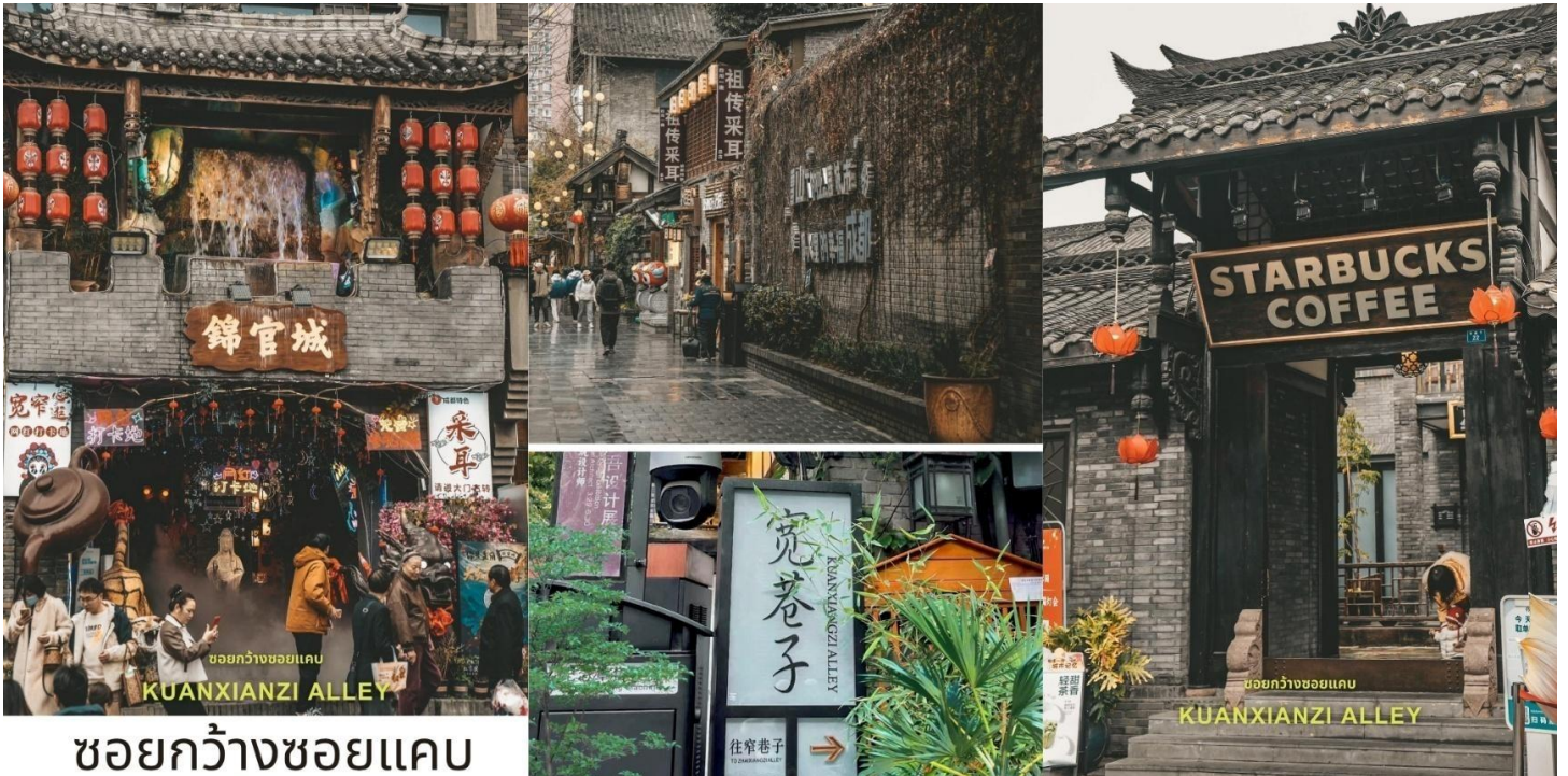
ชอยกว้างชอยแคบ

นำท่านชม ชอยกว้างแคบ(Kuanzhai Alley, 宽窄巷子) เส้นห้เมืองเก่าที่ผสมความทันสมัยใจกลางเจียงตุ ชอยกว้างแคบไม่ใช่แค่ถนนคนเดิน แต่เป็นย่าน ประวัติศาสตร์ ที่ได้รับการอนุรักษ์และปรับปรุงอย่างงดงามประกอบด้วยตรอกหลัก 3 สาย ที่ขนานกันไป โดยแต่ละตรอกสะท้อนบรรยากาศและบทบาทที่แตกต่างกัน ตั้งแต่สมัยราชวงศ์ซิงเมื่อ 300 กว่าปีก่อน จนถึงปัจจุบันย่าน ชอยกว้างแคบประกอบด้วย 3 ตรอก ได้แก่