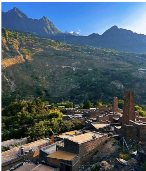
หมู่บ้านโบราณเซียงเถาผิง (Taoping Qiang Village)

นำท่านชม หมู่บ้านโบราณเซียงเถาผิง (Taoping Qiang Village, 桃坪羌寨) หมู่บ้านโบราณที่มีอายุกว่า 2,000 ปี ที่ได้รับฉายาว่า “ราชาแห่งสถาปัตยกรรมโบราณของชาวเซียง” เป็นหนึ่งในหมู่บ้านโบราณที่ได้รับการอนุรักษ์ไว้ดีที่สุดของชนเผ่าเซียง (Qiang) ที่มีความโดดเด่นไม่เหมือนใครด้วยสถาปัตยกรรมแบบ “ ป้อมปราการหิน ” ซึ่งเป็นเอกลักษณ์ของชนเผ่านี้ ทำให้หมู่บ้านดูเหมือนเขาวงกตที่ซับซ้อนและน่าค้นหา เมื่อก้าวเข้าสู่เถาผิงเซียงจ้าย คุณจะรู้สึกเหมือนได้ย้อนเวลากลับไปในอดีต บ้านเรือนและกำแพงทุกหลังสร้างจากหินล้วน ๆ โดยไม่ใช้ปูนซีเมนต์ แต่ใช้หินซ้อนกันอย่างมีศิลปะจนกลายเป็นโครงสร้างที่มั่นคงและแข็งแรง ระบบการออกแบบหมู่บ้านยังมีความซับซ้อนด้วยทางเดินใต้ดินและทางเดินบนหลังคาที่เชื่อมต่อถึงกัน ทำให้เกิดเป็นเขาวงกตที่สามารถใช้หลบภัยและป้องกันศัตรูในสมัยโบราณได้ มีระบบส่งน้ำใต้ดินและบนดินที่ชาญฉลาด น้ำไหลทั่วถึงทุกครัวเรือน ได้ชื่อว่า “ หมู่บ้านที่ไม่เคยขาดน้ำ ” จากนั้นนำท่านเดินทางสู่ เมืองเจิงตู (Chengdu, 成都)