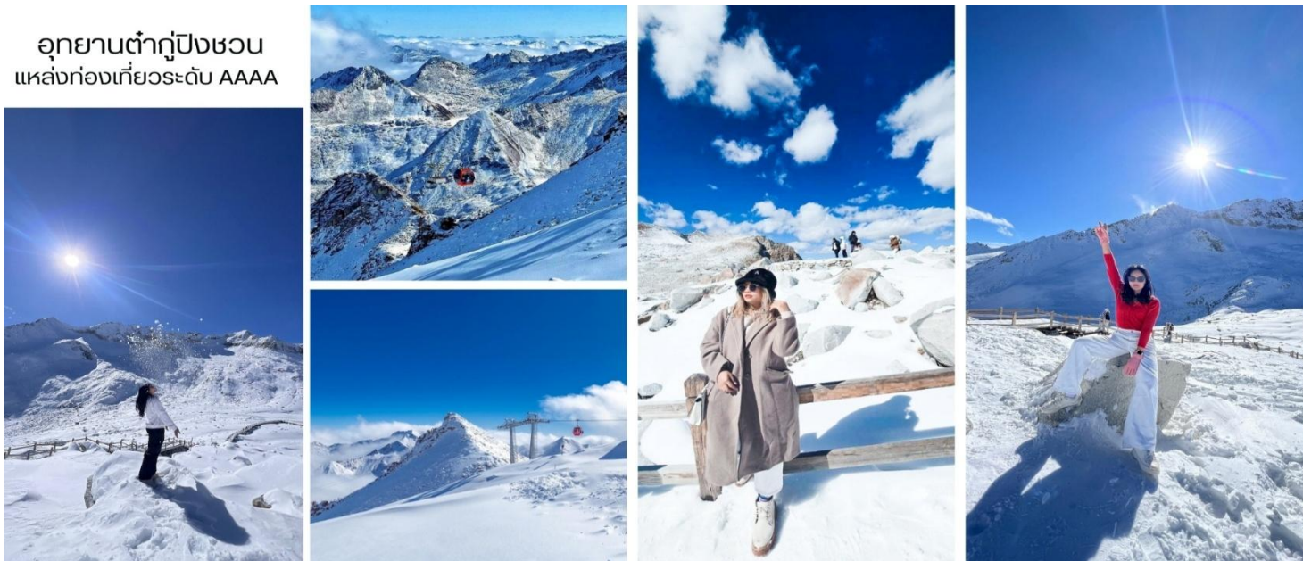
อุทยานต่ากู่ปิงชว่น แหล่งท่องเที่ยวระดับ AAAA