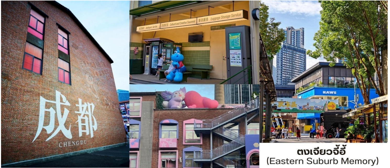
ตงเจียวจี้ (Eastern Suburb Memory)

นำท่านชม ชอยกว้างแคบ(Kuanzhai Alley, 宽窄巷子) เส้นห้เมืองเก่าที่ผสมความทันสมัยใจกลางเจียงตุ ชอยกว้างแคบไม่ใช่แค่ถนนคนเดิน แต่เป็นย่าน ประวัติศาสตร์ ที่ได้รับการอนุรักษ์และปรับปรุงอย่างงดงามประกอบด้วยตรอกหลัก 3 สาย ที่ขนานกันไป โดยแต่ละตรอกสะท้อนบรรยากาศและบทบาทที่แตกต่างกัน ตั้งแต่สมัยราชวงศ์ซิงเมื่อ 300 กว่าปีก่อน จนถึงปัจจุบันย่าน ชอยกว้างแคบประกอบด้วย 3 ตรอก ได้แก่