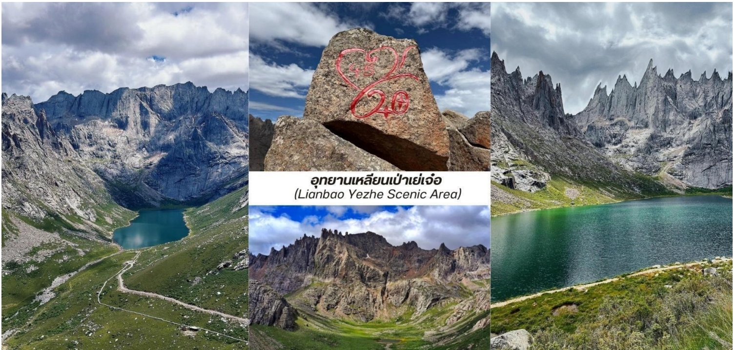
อุทยานเหลียนเป่าเย่เจ้อ (Lianbao Yezhe Scenic Area)

บาย นำท่านเดินทางสู่ เมืองหลี่เซียน (Lixian, 理县) ตั้งอยู่ในเขตที่ราบสูงอาปา มณฑลเสฉวนเป็นเมืองเล็กที่ซ่อนตัวอยู่ในหุบเขาที่สวยงามเป็นจุดหมายปลายทางที่สมบูรณ์แบบสำหรับนักเดินทางที่ต้องการ หลีกหนีจากความวุ่นวายของเมืองใหญ่เพื่อสัมผัสกับธรรมชาติที่เขียวสงบและวัฒนธรรมทิเบตที่เข้มข้น ใช้เวลาเดินทางประมาณ 4 ชั่วโมง