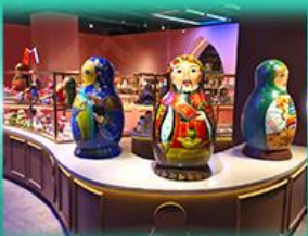
พิพิธภัณฑ์ ตุ๊กตาเปลูกอก