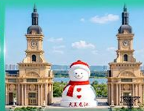
ตุ๊กตาคะมิยก์ ฮาร์บิน