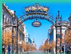
ย่านจหยาง สตรีท