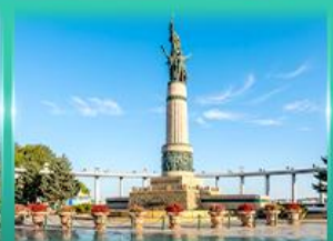
อนุสาวรีย์ชิงหลง