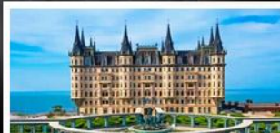
ไรไวน์และคฤหาสน์จางยู