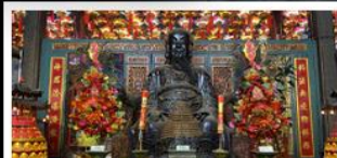
วัดบิกโตฮ่องกง