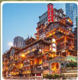
หงหยาดตั้ง

ไฮไลท์! อุทยานแห่งชาติหลุมบ่อฟ้า มรดกโลกระดับ 5A รถไฟฟ้าทะลุตึก ตึกตะเกียบ อลังการแสงสีหงหยาดตั้ง