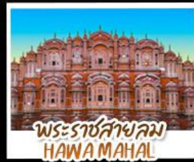
พระราชสาลอม HAWA MAHAL