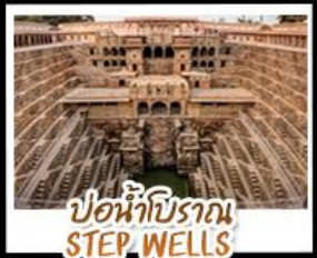
บ่อน้ำโบราณ STEP WELLS

เยือน Taj Mahal 1 ใน 7 สิ่งมหัศจรรย์ของโลก บ่อน้ำโบราณ Step wells - ประตุนกยูง City Palace ตลาดช้อปปิ้ง Janpath - พระราชสาลอม Hawa Mahal