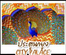
ประตุนกยูง CITY PALACE