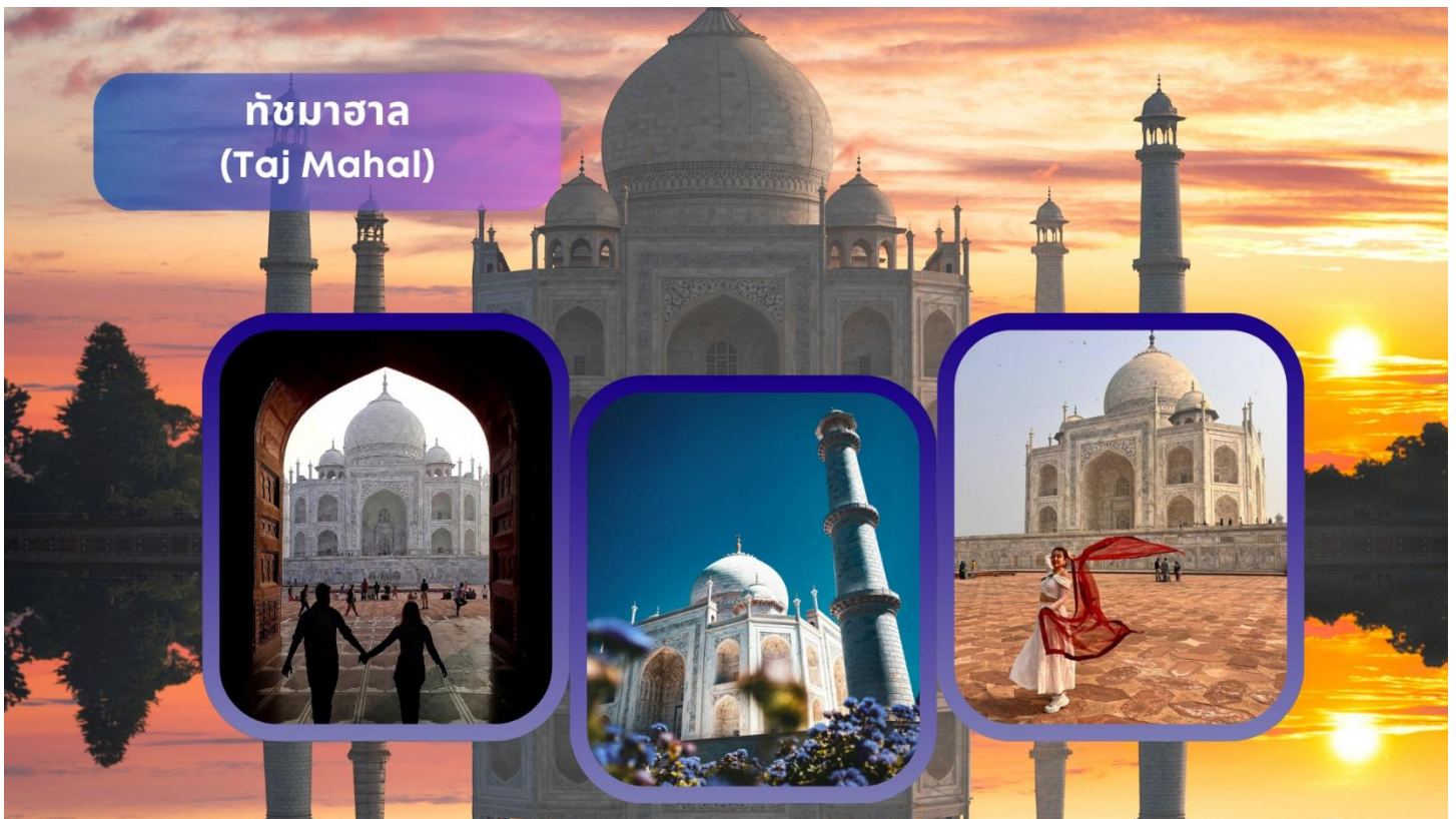
ทัชมาฮาล (Taj Mahal)

เข้าชมด้านใน ทัชมาฮาล (Taj Mahal) แหล่งมรดกโลกและเป็น 1 ใน 7 สิ่งมหัศจรรย์ที่สำคัญของโลก นำท่านเดินสู่ประตูสุสานที่สลักตัวหนังสือภาษาอาระบิกที่เป็นถ้อยคำอุทิศและอาลัยต่อบุคคลอันเป็นที่รักที่จากไปอนุสรณ์สถานแห่งความรักอันยิ่งใหญ่และอมตะของพระเจ้าชาห์จาฮันที่มีต่อพระนางมุมตซ์ โดยสร้างขึ้นในปี ค.ศ. 1631 และนำท่านถ่ายรูปกับลานน้ำพุที่มีอาคารทัชมาฮาลอยู่เบื้องหลัง แล้วนำท่านเข้าสู่ตัวอาคารที่สร้างจากหินอ่อนสีขาวบริสุทธิ์ที่ประดับลวดลายด้วยเทคนิคฝังหินสีต่างๆ ลงไปในเนื้อหิน สถาปัตยกรรมชิ้นเอกของโลกที่ออกแบบโดยช่างจากเปอร์เซีย โดยอาคารตรงกลางจะเป็นรูปโดมซึ่งมีหอคอยสี่เสาล้อมรอบ ตรงกลางด้านในเป็นที่ฝังพระศพของพระนางมุมตซ์ มาฮาล และ พระเจ้าชาห์จาฮัน ได้อยู่คู่เคียงกันตลอดชั่วชีวิต ทัชมาฮาลแห่งนี้ใช้เวลาก่อสร้างทั้งหมด 22 ปี โดยสิ้นเงินไป 41 ล้านรูปี มีการใช้ทองคำประดับตกแต่งส่วนต่างๆ ของอาคารหนัก 500 กิโลกรัม และใช้คนงานกว่า 20,000 คน ต่อมานำท่านเดินอ้อมไปด้านหลังที่ติดกับแม่น้ำยมนาโดยฝั่งตรงกันข้ามจะมีพื้นที่ขนาดใหญ่ถูกปรับดินแล้ว โดยเล่ากันว่าพระเจ้าชาห์จาฮันเตรียมที่จะสร้างสุสานของตัวเองเป็นหินอ่อนสีดำโดยตัวรูปอาคารจะเป็นแบบเดียวกันกับทัชมาฮาล เพื่อที่จะอยู่เคียงข้างกัน แต่ถูกออรังเซบ ยึดอำนาจและนำตัวไปคุมขังไว้ในป้อมอัคราเสียก่อน **เนื่องจากทัชมาฮาลปิดทุกวันศุกร์ กรณีที่เข้าทัชมาฮาลตรงกับวันศุกร์ ทางบริษัทขอสงวนสิทธิ์สลับโปรแกรมเที่ยวตามความเหมาะสม**