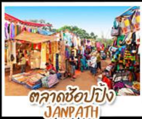
ตลาดช้อปปิ้ง JANPATH