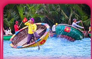
ล่องเรือกระดัง หมู่บ้านกิมทาน