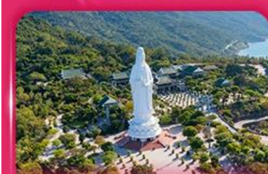
องค์กวนอิม วัดหลินอิ่ง