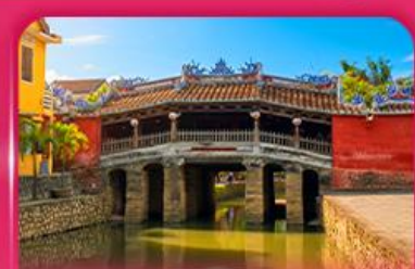
สะพานญี่ปุ่นโบราณ ฮอยอัน