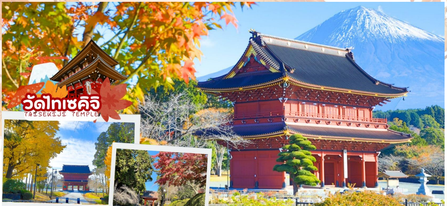
วัดไทเซคิจิ TAISEKIJJI TEMPLE

กลางวัน รับประทานอาหารกลางวัน ณ ร้านอาหาร (มื้อที่ 3)