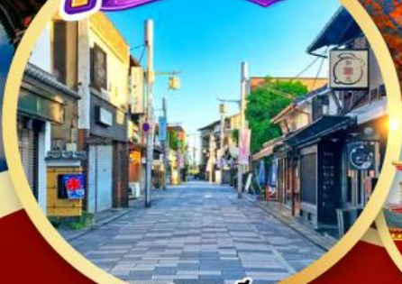
ถนนสายซาเซ็ว