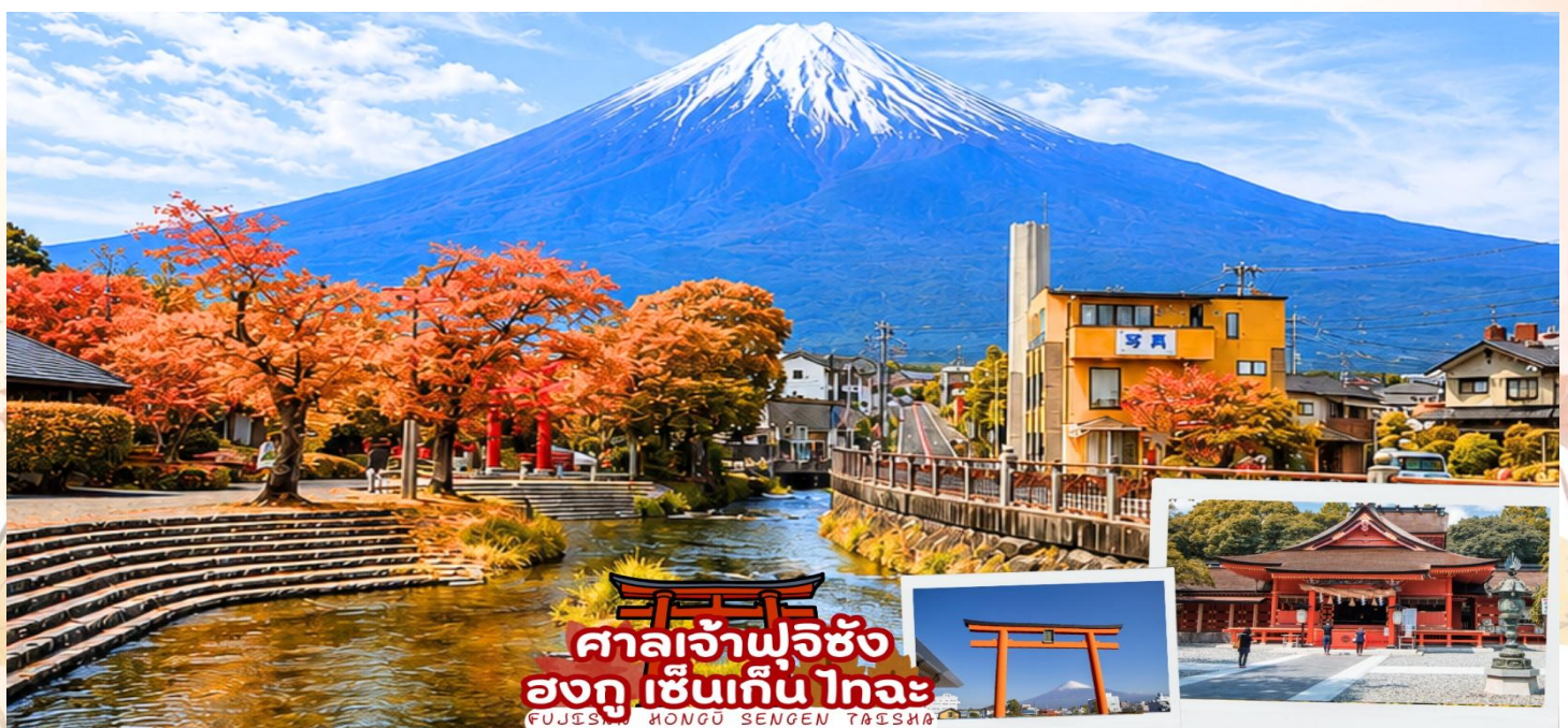
ศาลเจ้าฟูจิซัง ฮงกุ เซ็นเกิน ไทอะ FUJISAN HONGU SENGEN TAISHA

ศาลเจ้าฟูจิซัง ฮงกุ เซ็นเกิน ไทอะ (Fujisan Hongū Sengen Taisha) เป็นศาลเจ้าชินโต ตั้งอยู่ทางทิศตะวันตกเฉียงใต้ของฐานภูเขาไฟฟูจิ ในเมืองฟูจิโนะมิยะ จังหวัดชิซุโอกะ ครอบคลุมตั้งแต่ฐานภูเขาไฟฟูจิ ไปจนถึงยอดภูเขา ภายในศาลเจ้าเต็มไปด้วยความสงบ มีทั้งสถาปัตยกรรมแบบญี่ปุ่นโบราณ บ่อน้ำศักดิ์สิทธิ์ และวิวของภูเขาฟูจิที่งดงาม ศาลเจ้าแห่งนี้ตั้งอยู่ในตำแหน่งที่สามารถมองเห็นวิวภูเขาไฟฟูจิได้อย่างสวยงาม ด้วยบรรยากาศที่เงียบสงบและธรรมชาติรอบข้างสวยงาม ด้านหน้ามีน้ำไหลผ่านพร้อมกับเสาโทริสีแดง และภูเขาฟูจิ ทำให้ที่ศาลเจ้าแห่งนี้เป็นอีกหนึ่งจุดชมวิวภูเขาฟูจิและการถ่ายภาพที่สวยงามมาก