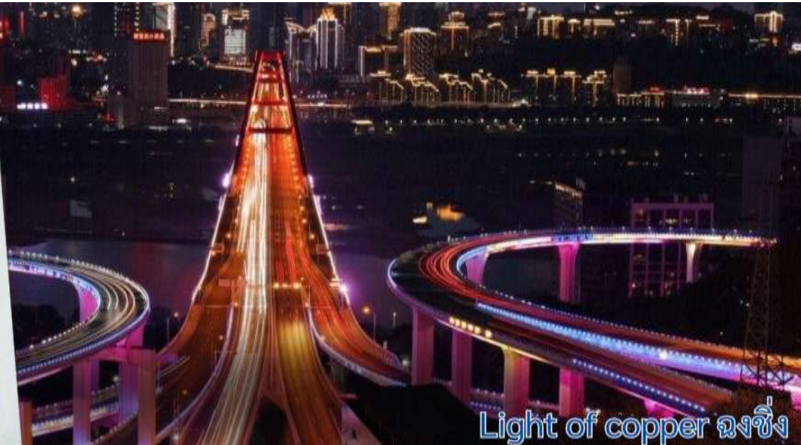
Light of copper ฉงชิ่ง

จากนั้นนำท่านเดินช้อปปิ้งที่ ตลาดหงหยาดัง เป็นแหล่งช้อปปิ้งขนาดใหญ่ ของเมืองฉงชิ่ง เต็มไปด้วยร้านค้ามากมาย ตกแต่งในสไตล์จีนโบราณ ที่โดดเด่นเห็นจะเป็นสินค้าแปรรูปและเครื่องเทศ บรรยากาศโดยรอบได้อารมณ์แบบจีนโบราณ ทั้งผู้คนร้านค้า การตกแต่ง และทิวทัศน์ที่สวยงามยามค่ำคืน นักท่องเที่ยวสามารถขึ้นสู่จุดชมวิวของ Hongyadong เพื่อรับลม เดินเล่น ชมวิวของแม่น้ำเจียหลิง ดูงานประติมากรรมและวิถีชีวิตของคนฉงชิ่งอย่างเพลิดเพลิน