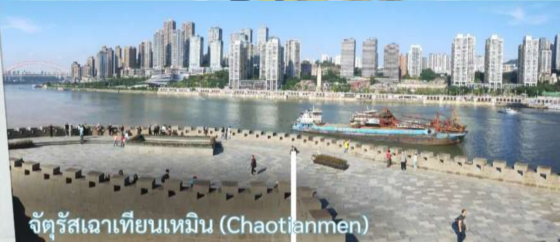
จัตุรัสเฉาเทียนเหมิน (Chaotianmen)

แนวถ่ายรูปวิวที่ Light of copper ฉงชิ่ง เป็นจุดชมวิวชื่อดังในมณฑลฉงชิ่ง ประเทศจีน ซึ่งได้รับความนิยมอย่างมากในกลุ่มนักท่องเที่ยวและช่างภาพ จุดชมวิวทางยกระดับโดดเด่นด้วยทางเดินลอยฟ้าทรงกลมที่เชื่อมต่อกันสามารถมองเห็นวิวพาโนรามาของ สะพานซูเจียป่า (Sujiaba Interchange) ที่โค้งไปมาอย่างซับซ้อน และสะพานข้ามแม่น้ำแยงซีเกียง ไช่หยวนป่า (Caiyuanba Bridge) ท่ามกลางตึกสูงระฟ้าบรรยากาศยามค่ำคืน เมื่อเปิดไฟเมืองในช่วงค่ำจะเห็นแสงสีทองและสีทองแดงสะท้อนความงดงามของ "เมืองภูเขา" ได้อย่างชัดเจน