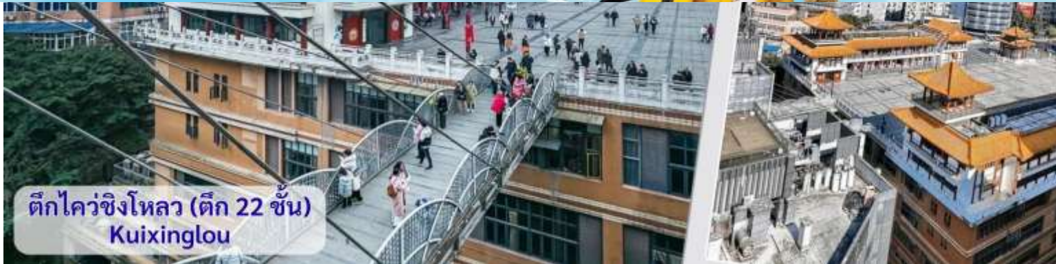
ตึกไควซิงโหลว (ตึก 22 ชั้น) Kuixinglou

จากนั้นอิสระถ่ายรูปหน้าตึกตะเกียบ ฉงชิ่ง(ด้านนอก) คือ ฉงชิ่งกั๋วไท่อาร์ตเซ็นเตอร์ (Chongqing Guotai Arts Center) เป็นแลนด์มาร์กสำคัญที่มีสถาปัตยกรรมคล้ายตะเกียบยักษ์สีแดงและดำวางซ้อนกัน เป็นศูนย์จัดแสดงงานศิลปะและสถานที่ท่องเที่ยวที่นิยมสำหรับการถ่ายรูป โดยเฉพาะในเวลากลางคืนเมื่อเปิดไฟสวยงาม สิ่งก่อสร้างอันมีเอกลักษณ์ อาคารนี้ถูกวางโครงสร้างให้มีรูปร่างคล้ายกอง "ตะเกียบยักษ์" สีดำและแดงที่วางซ้อนกันเป็นชั้นๆ ที่ส่วนปลายของตะเกียบสีแดงจะมีตัวอักษรจีนคำว่า "กั๋ว" ประทับอยู่ ซึ่งมีความหมายถึง ชาติหรือประเทศ ส่วนที่ปลายตะเกียบสีดำ จะมีอักษรจีนคำว่า "ไท่" ประทับอยู่ ซึ่งหมายถึง ความเจียบสงบ หรือความอุดมสมบูรณ์