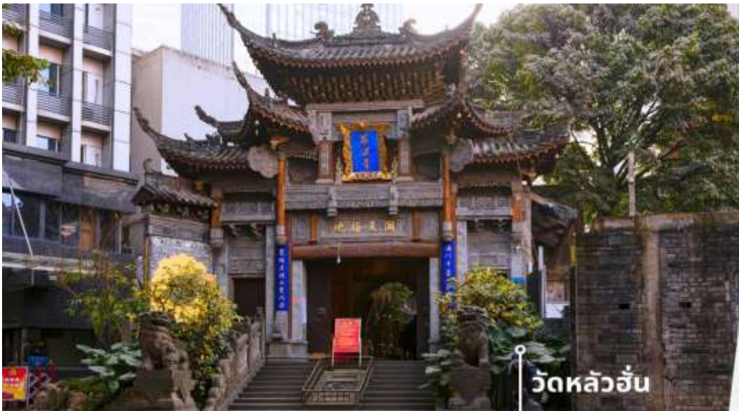
วัดหลัวฮั่น

นำท่านเดินทางสู่ วัดหลัวฮั่น (Luohan Temple) วัดสำนักงานใหญ่พุทธสมาคมแห่งนครฉงชิ่ง เป็นวัดเก่าแก่ที่สุดในฉงชิ่ง (Chongqing) ซึ่งสร้างขึ้นเมื่อ 1,000 ปีก่อน มีประวัติความเป็นมายาวนานเป็นจุดหมายทางศาสนาและเป็นศูนย์กลางของชาวพุทธในภูมิภาคการท่องเที่ยวที่สำคัญของภูมิภาค และเป็นแหล่งเรียนรู้ที่สำคัญของศิลปวัฒนธรรมจีน วัดนี้ประดิษฐานพระอรหันต์ถึง 500 องค์ แต่ละองค์มีลักษณะ ท่าทาง และสีหน้าแตกต่างกัน มีสถาปัตยกรรมแบบจีนโบราณที่สวยงามและละเอียดอ่อน พระอรหันต์ 500 องค์ แกะสลักด้วยหินและไม้ สะท้อนถึงความเชื่อในพุทธศาสนาและฝีมือศิลปะจีน