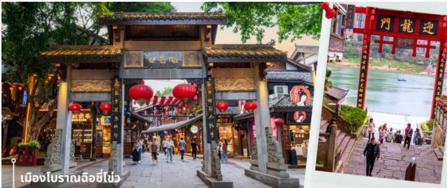
เมืองโบราณฉิ่งชิ่ง

ทราเวลซีกด์ ขอเชิญร่วมฉลองครบรอบ 47 ปีของบริษัท ทราเวลซีกด์ จำกัด โดยจัดโปรแกรมทัวร์พิเศษ นำท่านชมเมืองโบราณริมแม่น้ำเจียหลิง เป็นแหล่งรวมของขนม ของกินพื้นเมือง ของฝาก รวมถึงมีวัดและร้านค้ามากมาย ให้ความรู้สึกเหมือนได้ย้อนเวลากลับไปในอดีต ภายในพื้นที่เต็มไปด้วยร้านค้าเก่าแก่ที่ขายทั้งอาหารพื้นเมือง ของกิน และของฝากมากมาย ทั้งยังมีการแสดงวัฒนธรรมพื้นบ้านให้นักท่องเที่ยวได้ชม ให้ความรู้สึกเหมือนหลุดเข้าไปในซีรีส์จีนย้อนยุค ที่เที่ยวฉิ่ง ที่เหมาะแก่การมาเดินเที่ยว ชิมอาหาร ถ่ายรูป และสัมผัสวิถีชีวิตแบบดั้งเดิมของชาวฉิ่งอย่างใกล้ชิดในบรรยากาศที่แสนสบาย