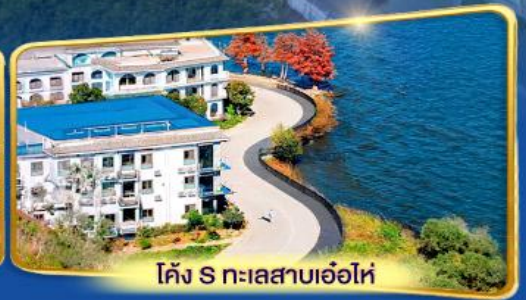
โค้ง S ทะเลสาบเอ๋อไห่