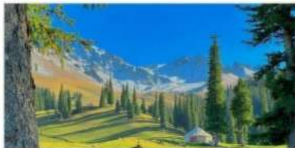
ทุ่งหญ้านาลาตี