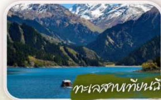
ทะเลสาบเทียนฉิว

ข้างหน้าคือพินทงญา ฉากหลังคือภูเขาหิมะอันยิ่งใหญ่