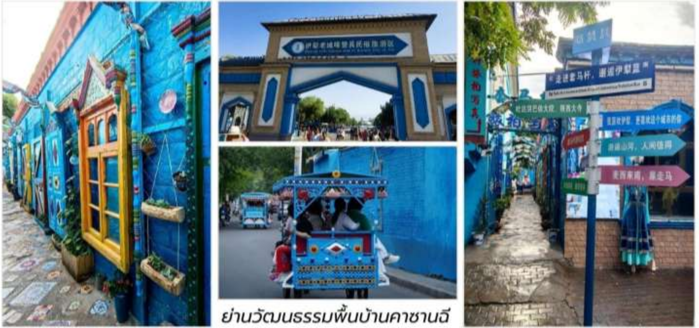
ย่านวัฒนธรรมพื้นบ้านคาซานจี

จากนั้นนำท่านชม หมู่บ้าน วัฒนธรรมอุยกูร์ (Kazanchi Folk Tourism Area, 卡赞其民俗园) หัวใจแห่งวัฒนธรรมอุยกูร์กลางเมืองอู่หนิง สัมผัสกลิ่นอายวัฒนธรรมดั้งเดิมของชาวอุยกูร์และชนกลุ่มน้อยใน ซินเจียง แบบใกล้ชิดที่สุด ย่านคาซานจีเปรียบเสมือน“พิพิธภัณฑ์มีชีวิต”ที่บอกเล่าเรื่องราวของผู้คนผ่านบ้านดิน โบราณสือบอุ่น ตรอกแคบที่คดเคี้ยวและรอยยิ้มของผู้เฒ่าผู้แก่ในชุดพื้นเมืองที่นุ่งผ้าด้วยบ้านเรือนแบบอุยกูร์ ดั้งเดิมกว่า 300หลัง ซึ่งสร้างขึ้นมาตั้งแต่ยุค ราชวงศ์ซิงและได้รับการอนุรักษ์ไว้อย่างงดงาม อิสระให้ท่านได้เลือกเดิน ชมงานหัตถกรรมพื้นบ้าน เช่น การทอพรม, แกะสลักไม้, ตีทองแดงและการทำขนมแบบอุยกูร์พร้อมชมการแสดง ดนตรีและการเดินพื้นเมืองที่จัดขึ้นเป็นระยะเสน่ห์ของคาซานจียังอยู่ที่วิถีชีวิตที่ดำเนินไปอย่างเรียบง่าย ผู้คนยังคงอบขนมปัง“นาน” ในเตาโบราณพูดภาษาท้องถิ่นและยิ้มต้อนรับนักท่องเที่ยวด้วยความจริงใจย่านนี้เป็นที่รวมของวัฒนธรรมอาหาร ศิลปะ และชีวิตท้องถิ่นอย่างแท้จริงจนกลายเป็นหมุดหมายสำคัญสำหรับนักท่องเที่ยวที่ต้องการเปิดมุมมองใหม่ของซินเจียงไม่ใช่แค่ทะเลทรายหรือภูเขาหิมะ แต่คือหัวใจของผู้คนในดินแดนปลายสุดของจีนแห่งนี้ การมาเยือน คาซานจี แล้วคุณจะได้เข้าใจว่า“วัฒนธรรม”ไม่ได้ถูกเก็บไว้ในพิพิธภัณฑ์ แต่มีมีชีวิตอยู่ในทุกยิ้มทุกรอยเท้าและทุกเสียง ดนตรีที่นี้