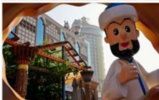
ตลาดนานาชาติซินเจียงแกรนด์บาร์ซาร์