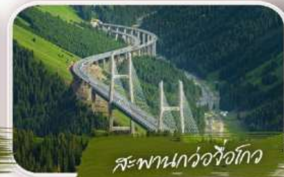
สะพานถั่วจื่อโกว

ล่องเรือ ชมความยิ่งใหญ่ ของ "เทือกเขาแห่งสวรรค์"