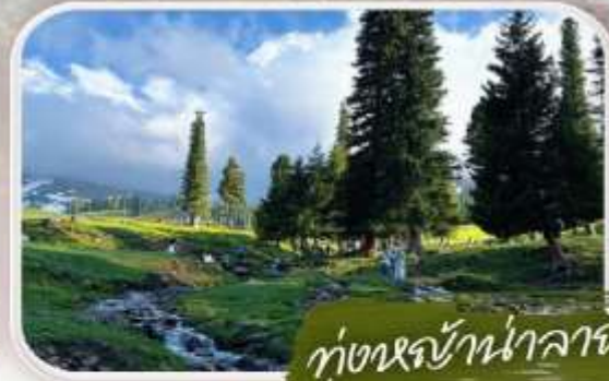
ทุ่งหญ้ามาลาตี

ข้างหน้าคือพินทงญา ฉากหลังคือภูเขาหิมะอันยิ่งใหญ่