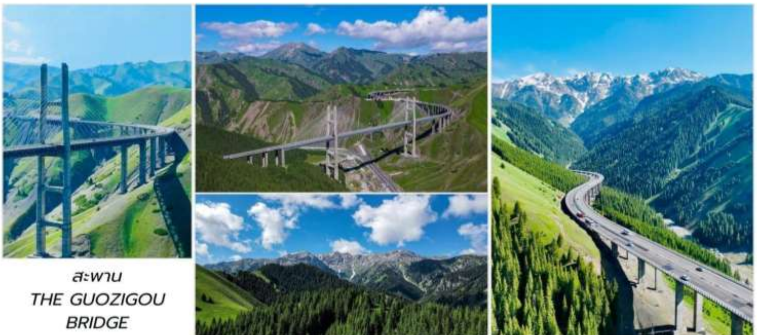
สะพาน THE GUOZIGOU BRIDGE

จากนั้นนำท่านแวะจุดชมวิวกว สะพานก๋อจื่อโกว (Guozigou Bridge 果子沟大桥) ซึ่งตั้งอยู่ในแถบฮั่วเจิ้ง ตัวสะพานทอดข้ามหุบเขาเทียนชานถือเป็นหนึ่งในสะพานถนนที่สวยงามที่สุดในจีนที่นักท่องเที่ยวจะมาแวะเช็คอินและถ่ายรูปสะพานหลักมีความยาว 700 เมตร ส่วนพื้นสะพานสูงจากกันหุบเขาสูงที่สุดถึง 200 เมตร หรือประมาณตึก 66 ชั้น สะพานแห่งนี้เชื่อมต่อระหว่างทะเลสาบไซหลี่มู่และทุ่งลาเวนเดอร์ในอำเภอฮั่วเจิ้ง จากนั้นนำท่านเดินทางสู่ เมืองยี่หนิง (Yining 伊宁) เป็นเมืองหลวงของเขตอีหลีเคยเป็นจุดแวะพักสำคัญบน เส้นทางสายไหมโบราณและเป็นที่อยู่อาศัยของชนเผ่ากว่า 40 กลุ่ม และได้รับฉายาว่า "เจียงหนานหลังกำแพงเมืองจีน" ใช้เวลาเดินทางประมาณ 1.5-2 ชั่วโมง