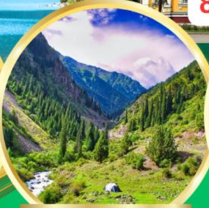
Ala Archa National Park