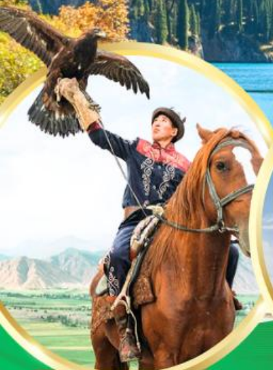
ชมโซว์นกลินทรีย์