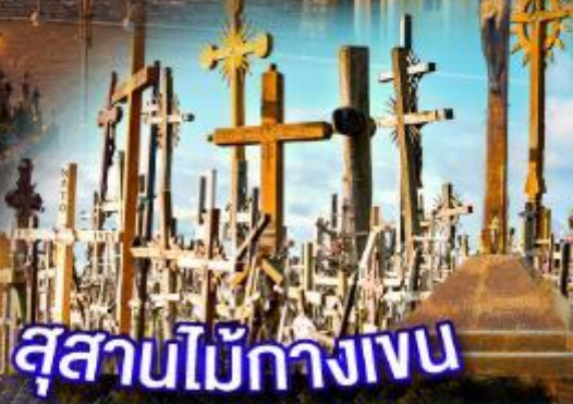
สุสานไม้กางเขน

พิเศษ!! บอลติกและสแกนดิเนเวีย ล่องเรือ Siljaline, DFDS Seaways