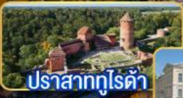
ปราสาททุโรต้า