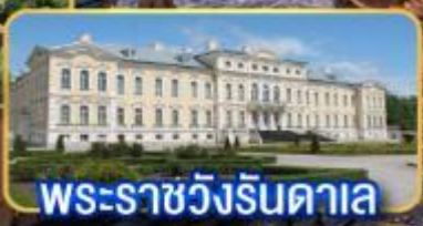
พระราชวังรินดาลา