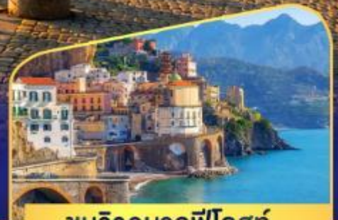
ชนวิวมาลฟีโดสก์