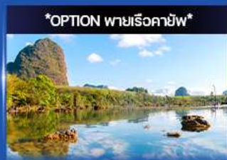
คลองหurut (คลองน้ำใส)