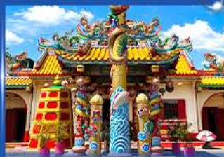
วัดพญาเจ๊กำก้งเยี่ย