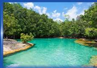
เสมภต กระบี่