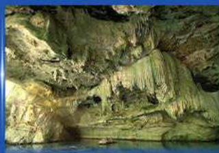
ถ้ำเลเขากอบ Unseen Thailand