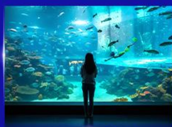
อควาเรียมยักษ์รูปเต่า