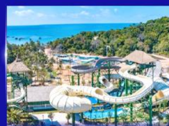
สวนสนุก Sun world Hon thom