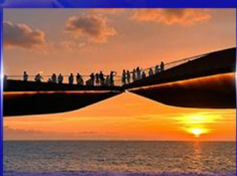
สะพานจูบ Sunset Town