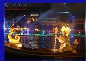
ชมโชว์เวนิสจำลอง แกรนด์เวิลด์