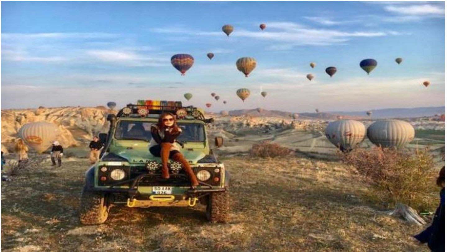
3. Classic Car นั่งรถคลาสสิก เปิดประทุน สูดอากาศ เย็น สดชื่น พร้อมชมบอลลูนสีสดใส วิวเมือง คัปปาโดเกีย ค่าใช้จ่าย 120 USD / ท่าน