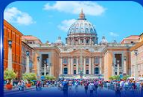
นครรัฐวาติกัน โรม