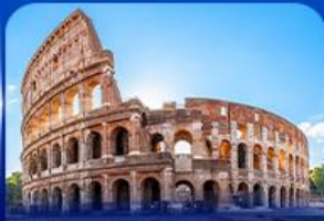
เข็ควินดัง โคลอสเซียม โรม