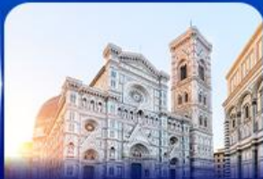
ชมเมืองแห่งศิลปะ ฟลอเรนซ์