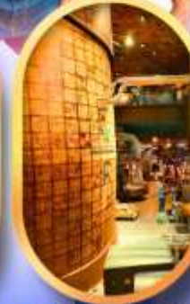
ร้านสตาร์บักส์