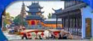
Zhujiajiao Ancient Town ล่องเรือเมืองโบราณ

เซี่ยงไฮ้ ดิสนีย์แลนด์ เมืองโบราณจูเจียเจียว