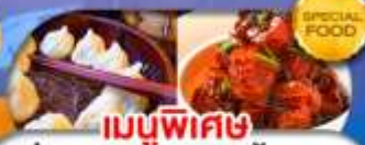
เมนูพิเศษ เสี่ยวหลงเปา หมูน้ำแดง เดินทาง ต.ค. 69 - มี.ค. 70