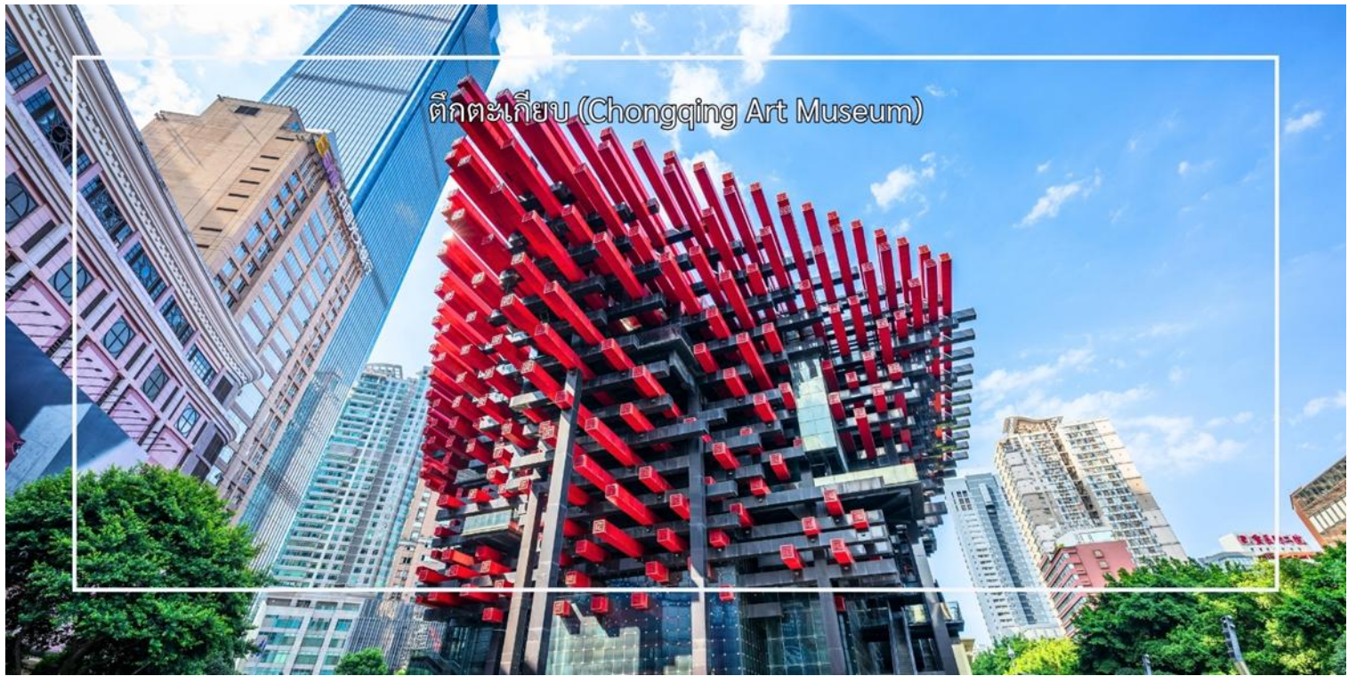
ตึกตะเกียบ (Chongqing Art Museum)

นำท่านสู่ ถนนคนเดินเจียงฟางเป่ย์ (Jiefangbei Pedestrian Street) ย่านการค้าและแลนด์มาร์กสำคัญที่สุดแห่งหนึ่งของเมือง ฉงชิ่ง และได้รับการขนานนามว่าเป็น "ถนนสายแรกแห่งจินตตะวันตก" โดยมีอนุสาวรีย์ปลดปล่อยประชาชน (Jiefangbei Monument) ตั้งอยู่ใจกลางย่านแห่งนี้ ที่นี่คือหนึ่งในแหล่งช้อปปิ้งและท่องเที่ยวที่สำคัญที่สุดในเมืองฉงชิ่ง (Chongqing) เป็นพื้นที่ที่มีชีวิตชีวาและคึกคัก ถนนนี้ตั้งอยู่ใกล้กับสถานที่ท่องเที่ยวสำคัญอื่นๆ เช่น ตึกตะเกียบ ทำให้สามารถเดินเที่ยวชม เดินเล่น ถ่ายภาพ ได้อย่างสะดวก ถนนสายนี้มีบรรยากาศที่มีชีวิตชีวา และยังเต็มไปด้วยร้านค้าสินค้าแบรนด์เนมร้านสินค้าท้องถิ่นและร้านค้าขายสินค้าต่างๆ เช่น เสื้อผ้าเครื่องประดับและของที่ระลึก