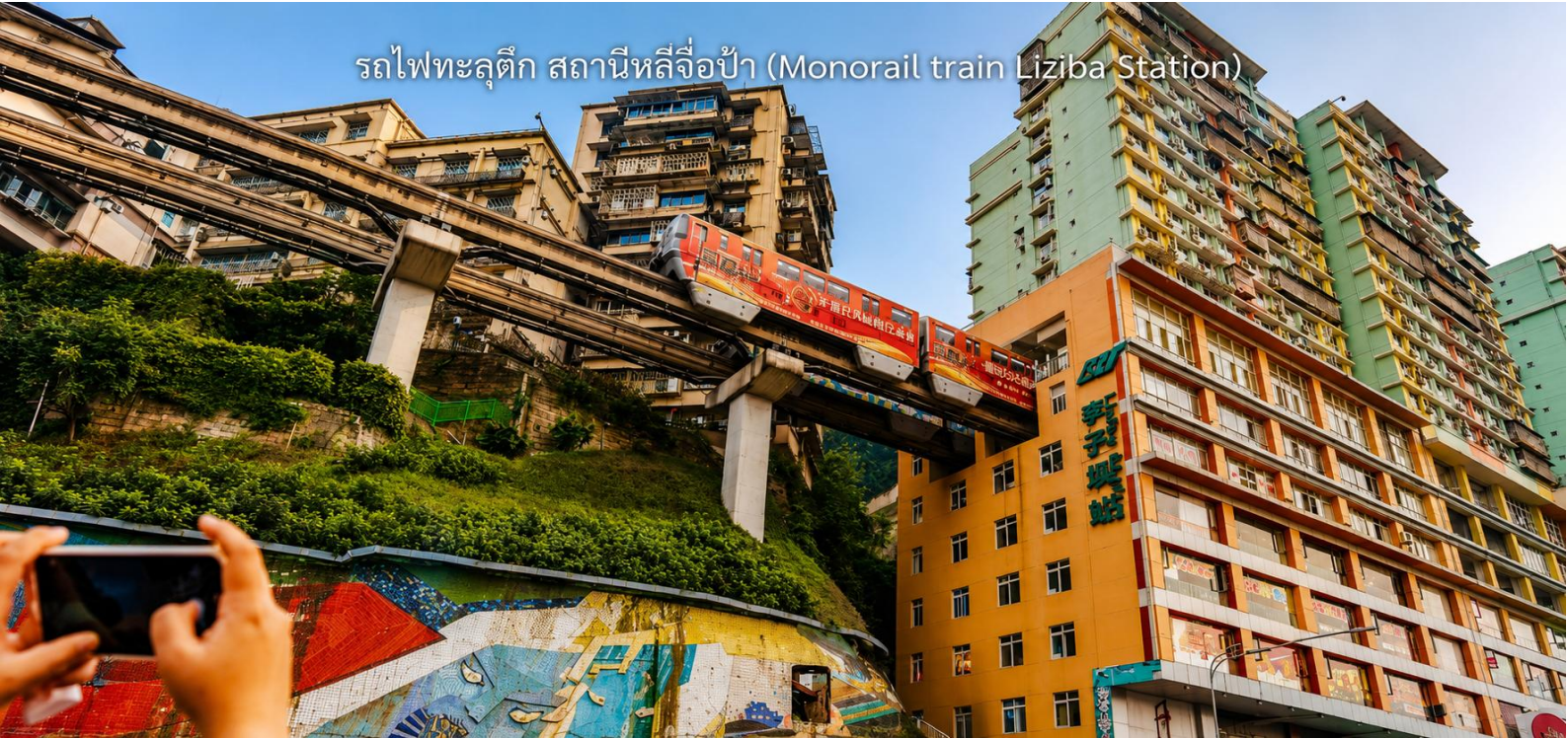
รถไฟทะลุตึก สถานีหลี่จื่อป้า (Monorail train Liziba Station)

จากนั้นนำท่าน นั่งรถไฟทะลุตึก (Monorail Train) หนึ่งในประสบการณ์ที่น่าสนใจและเป็นเอกลักษณ์ในเมืองฉงชิ่ง รถไฟเส้นนี้มีเส้นทางที่ผ่านอาคารและที่อยู่อาศัย ทำให้ผู้โดยสารรู้สึกเหมือนกำลังนั่งรถไฟที่ทะลุผ่านตึกสูง เส้นทางที่น่าสนใจในรถไฟนี้รวมถึงสถานีที่มีชื่อเสียง เช่น สถานีหลี่จื่อป้า (Liziba Station) ซึ่งตั้งอยู่ในพื้นที่ที่มีความหนาแน่นของประชากร การนั่งรถไฟทะลุตึกนี้เป็นวิธีที่ยอดเยี่ยมในการสัมผัสกับวัฒนธรรมเมืองฉงชิ่ง และชื่นชมกับการพัฒนาเมืองที่น่าทึ่ง หากคุณมีโอกาสไปเยือนฉงชิ่ง อย่าลืมลองนั่งรถไฟเส้นนี้เพื่อสัมผัสประสบการณ์ที่ไม่เหมือนใคร