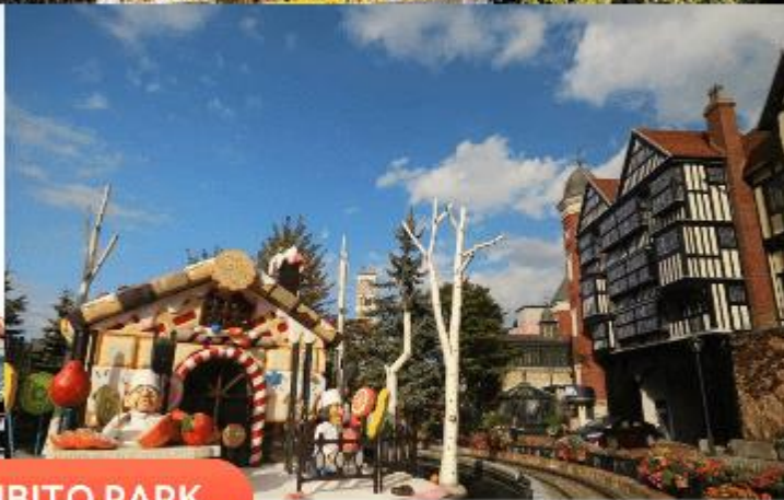
SHIROI KOIBITO PARK