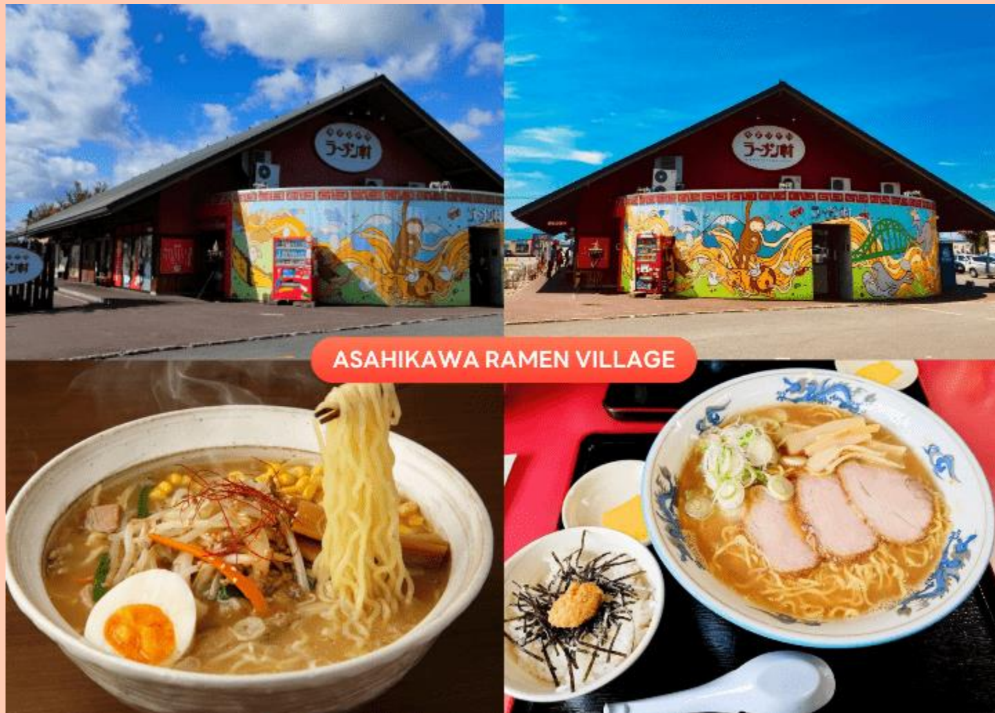
ASAHIKAWA RAMEN VILLAGE

นำท่านเดินทางกลับสู่ เมืองอาซาฮิดาว่า (Asahikawa) เพื่อนำท่านสู่ หมู่บ้านราเมนอาซาฮิดาว่า (Asahikawa Ramen Village) แหล่งรวมราเมนเจ้าดังของเมืองอาซาฮิดาว่า ที่คัดสรรร้านยอดนิยมไว้ถึง 8 ร้านในที่เดียว เพลิดเพลินกับการลิ้มลองราเมนสูตรต้นตำรับฮอกไกโด สไตส์ชูปโชยุที่ขึ้นชื่อเรื่องความหอมกลมกล่อม พร้อมเลือกชิมแต่ละร้านได้ตามใจ อีกทั้งยังมีโซนขายของที่ระลึก และพิพิธภัณฑเล็ก ๆ ให้ได้เรียนรู้ประวัติราเมนอีกด้วย