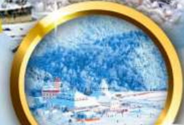
ลานสกีซีหลิง