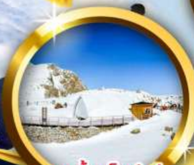
ธารน้ำแข็งต่ากู่