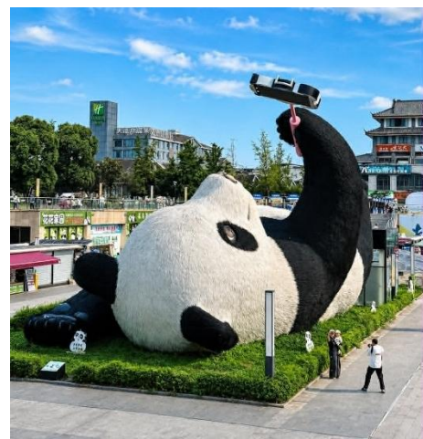
วัดต้าสือ (Daci Temple)

เดินทางสู่อีก 1 จุดเช็คอิน ที่ไม่ควรพลาดของเมืองตูเจียงเยียน จัตุรัสหย่างเทียนวู (Yangtianwo Square) เป็นจุดถ่ายรูปยอดนิยมซึ่งท่านจะได้ชมประติมากรรมรูปปั้น หมีแพนด้าเซลฟี่ (Selfie Panda) หมีแพนด้าตัวใหญ่ที่กำลังนอนหงายเซลฟี่ ณ ใจกลางจัตุรัสหย่างเทียนวู เป็นภาพแสนน่ารักซึ่งอันจะทำให้เราหลงไหลและไม่พลาดที่จะถ่ายรูปคู่เป็นที่ระลึกกันเลยทีเดียว จากนั้นนำท่านเดินทาง เที่ยวยาม วัดต้าสือ (Daci Temple) คือวัดพุทธนิกายมหายานที่มีชื่อเสียงโด่งดังและเก่าแก่ที่สุดแห่งหนึ่งในภูมิภาคตะวันตกเฉียงใต้ของจีน มีประวัติศาสตร์อันยาวนานกว่า 1,600 ปี วัดต้าสือ มีสถาปัตยกรรมจีนแบบดั้งเดิมที่สวยงาม โดยมีอาคารและโครงสร้างที่สร้างขึ้นจากไม้และอิฐ มีหลังคาสูงและตกแต่งด้วยลวดลายที่ละเอียดบริเวณรอบๆ วัดมีสวนและพื้นที่สีเขียวที่สวยงาม นักท่องเที่ยวสามารถเดินเล่นและสัมผัสกับความงามของธรรมชาติได้