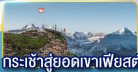
กระเช้าสู่ยอดเขาเพียสตัด