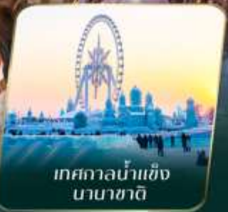
เทศกาลน้ำแข็ง นานาชาติ