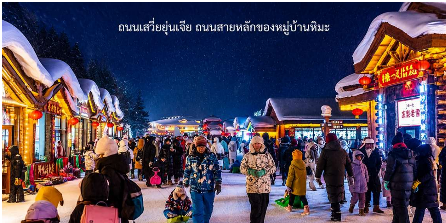
ถนนเสวี่ยยุ่นเจีย ถนนสายหลักของหมู่บ้านหิมะ

นำท่านเดินชมบรรยากาศบน ถนนเสวี่ยยุ่นเจีย ถนนสายหลักของหมู่บ้านหิมะ ที่ได้เต็มไปด้วยร้านค้าของที่ระลึก ร้านอาหาร ท้องถิ่น และร้านกาแฟน่ารัก ๆ ถนนสายนี้ถูกตกแต่งด้วยไฟประดับและโคมแดงสไตล์จีน เพิ่มเสน่ห์ให้บรรยากาศอบอุ่น และมีชีวิตชีวาที่ท่านสามารถช้อปปิ้งสินค้าท้องถิ่น หรือสินค้าแฮนด์เมด พร้อมถ่ายภาพเก็บความทรงจำในมุมสวย ๆ ของหมู่บ้าน ได้ตลอดทั้งคืน