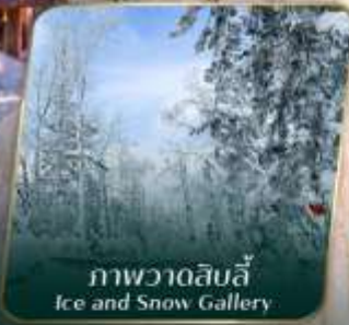
ภาพวาดสิบลี Ice and Snow Gallery

ก่อนเฟิร์มออกเดินทาง ตั้งแต่วันที่ 15 ก้าว ขึ้นไป