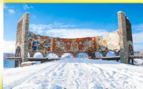
อนุสรณ์สถานรัสเซีย