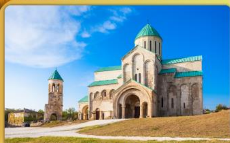
มหาวิหารบากรตี