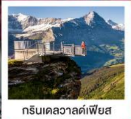
กรีนเดลวาลด์เฟียส