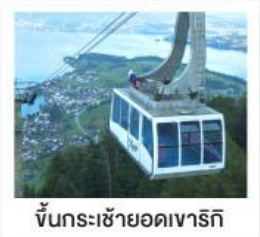
ขึ้นกระเช้ายอดเขาริกิ