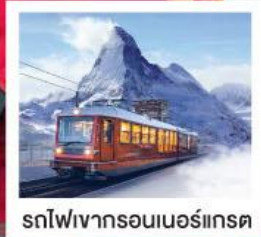
รถไฟเขาวงกตเออร์เทรต